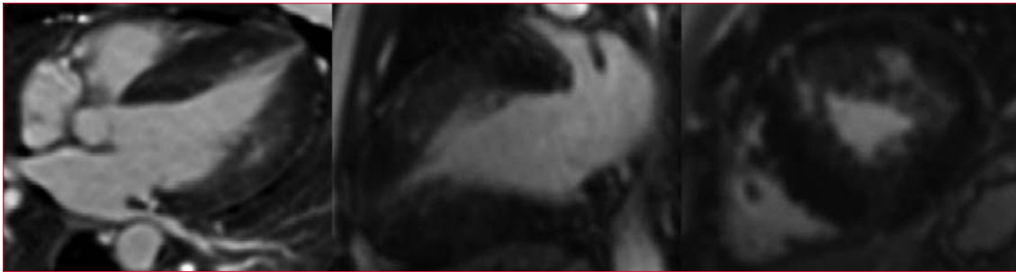
Figura 3. Resonancia magnética cardíaca en secuencia de realce tardío de gadolinio.

niños con VI hiperdinámico no dilatado) confirma el diagnóstico, considerando que la distribución de la hipertrofia puede ser variable (3) . El ECG puede evidenciar HVI, ondas Q anormales y alteraciones en la repolarización, como inversión de la onda T (8) . En el ecocardiograma y la RMC se visualiza la HVI, pudiendo existir realce tardío con gadolinio en esta última (6) . Una expresión incompleta de la enfermedad se presenta en más del 30% de los portadores de las mutaciones, con grados menores de HVI, algunas veces en asociación con dimensiones intracavitarias reducidas del VI, índices de función sistólica hiperdinámicos, anormalidades de los músculos papilares y de la anatomía valvular mitral e índices anormales de función diastólica con auriculomegalia (10) . La ecocardiografía bidimensional permite realizar maniobras provocativas y proporciona estimaciones precisas de los gradientes intraventriculares y de la regurgitación valvular (6) . Los gradientes del tracto de salida de 30 mmHg o más en reposo son marcadores independientes del desarrollo de síntomas de IC (7) . El descubrimiento de un gradiente elevado con el ejercicio puede, además, orientar las decisiones terapéuticas (3) . La RMC suele ser superior a la ecocardiografía bidimensional en la evaluación de la HVI en lugares atípicos, como la pared libre anterolateral, el ápex, el septo posterior y regiones no contiguas de hipertrofia, distinguiendo también procesos infiltrativos y tejido cicatricial (6) .