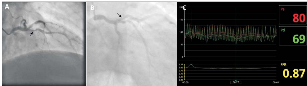
Figura 1. Angiografía selectiva de coronaria izquierda, proyección craneal derecha (A) y proyección caudal derecha (B). Las flechas negras señalan una estenosis indeterminada proximal de arteria descendente anterior. C: Resultado FFR de lesión visualizada en A y B.

presenta la relación entre el flujo real máximo que se logra en el vaso a través de la estenosis en relación con el flujo máximo posible si no existiera dicha estenosis. Se considera a una estenosis como funcionalmente significativa cuando implica una caída \geq 20\% (FFR \leq 0,80 ), por lo que existiría un beneficio en tratarla, siendo seguro no revascularizar con un FFR > 0,80 .